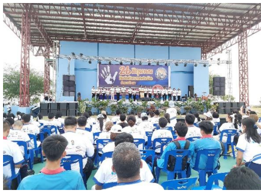
ภาพกิจกรรม : ยุทธศาสตร์ที่ 1 การรณรงค์ปลูกจิตสำนึกและสร้างกระแสนิยมที่เอื้อต่อการป้องกันและแก้ไขปัญหายาเสพติด