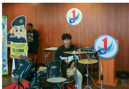
ภาพกิจกรรม : ยุทธศาสตร์ที่ 2 การเสริมสร้างภูมิคุ้มกันทางจิตใจให้แก่เยาวชน